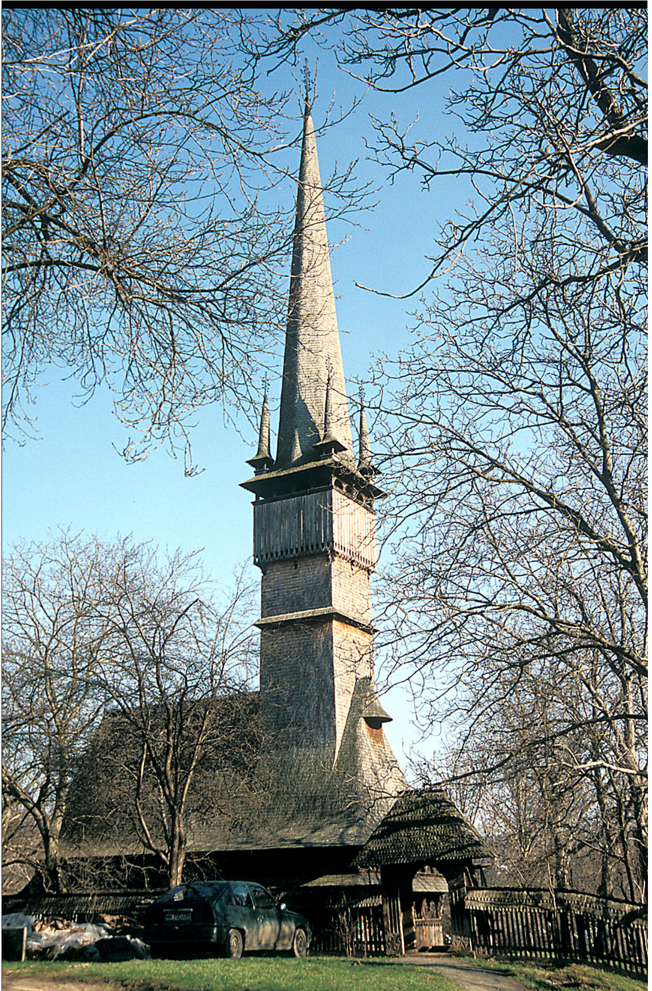
Studienreise nach RUMÄNIEN vom 16.06 - 24.06.2007