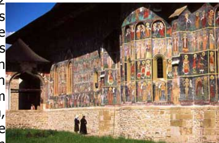
Südseite des Klosters Sucevita

Heute besichtigen wir einige der schönsten Klöster und Kirchenanlagen Rumäniens, gebaut im traditionellem griechisch orthodoxem Stil. Zuerst das Kloster Moldovita, welches 1532 von Petru Rares, Sohn Stefan des Großen, errichtet wurde. Dieses Monument feudaler Kunst paßt sich auch als Festung harmonisch in die waldreiche Umgebung ein. Die Außenmalereien sind besonders beeindruckend und an der Südseite der Kirche auch heute noch in einem sehr guten Zustand. Im Museum besichtigen wir u.a. den Herrscherstuhl von Petru Rares, religiöse Möbelstücke aus dem 17. Jahrhundert, Heiligenbilder, wertvolle Bücher, Stickereien, Schnitzereien, schmückende Keramik und auch den Preis "Pomme d'Or", der von der Internationalen Journalistenföderation den Klöstern der Bukowina verliehen wurde. Weiterfahrt über sanfte Hügel und